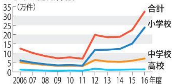
いじめの認知件数